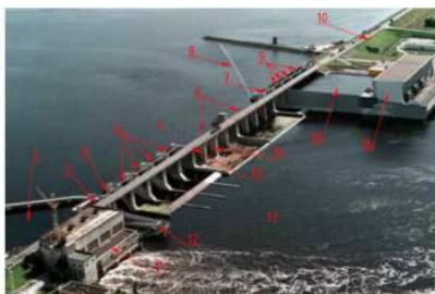
Ķeguma hidroelektrostācijas kopskats

1,15 – avankameras; 2,3,7 – sektora aizvari; 4,9 – segmenta aizvari; 5 – augšbjefs; 6 – vārstu aizvari; 8 – aizsargbonas; 10 – kreisā krasta zemes uzbēruma dambis; 11 – HES 1. ēka; 12 – Zivju ceļš; 13 – autoceļa tilts; 14 – ūdens pārgāznes aizsprosts; 16 – HES 2. ēka.