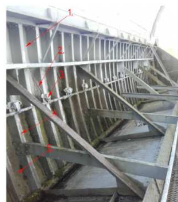
Segmenta aizvara virsma ar sildkabeļiem no lejasbjefa puses

Šo iemeslu pēc ir jāvērtē liela uzmanība aizvaru apsildei, neļaujot tiem ziemas laikā aizsaldst, kas novestu pie to darbības traucējumiem.